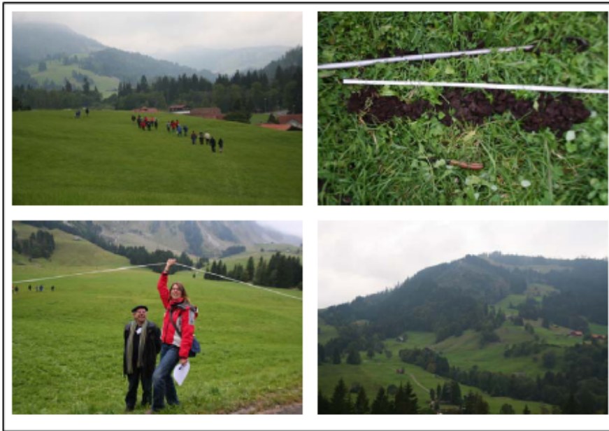
Rencontre des SPSC dans l'Entlebuch

La Commission de sélection et de reconnaissance (CSR) s'est réunie à plusieurs reprises durant 2008. Elle a examiné les dossiers de candidatures, mais elle a également mené une réflexion sur l'avenir des SPSC. Elle a reconnu parfois le manque de pratique dans le domaine de la pédologie « pure » des candidats et elle propose une modification du règlement de reconnaissance et de sélection. Il s'agit en particulier d'assurer (i) que les SPSC possèdent effectivement une expérience en pédologie ; (ii) que les SPSC ont une pratique de la mise en œuvre des mesures de protection des sols sur les chantiers ; (iii) qu'une formation continue soit suivie afin de garantir la qualité des travaux et la crédibilité de la liste.