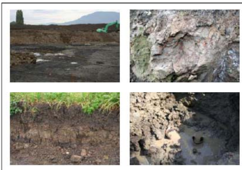
Chantier de la Seymaz