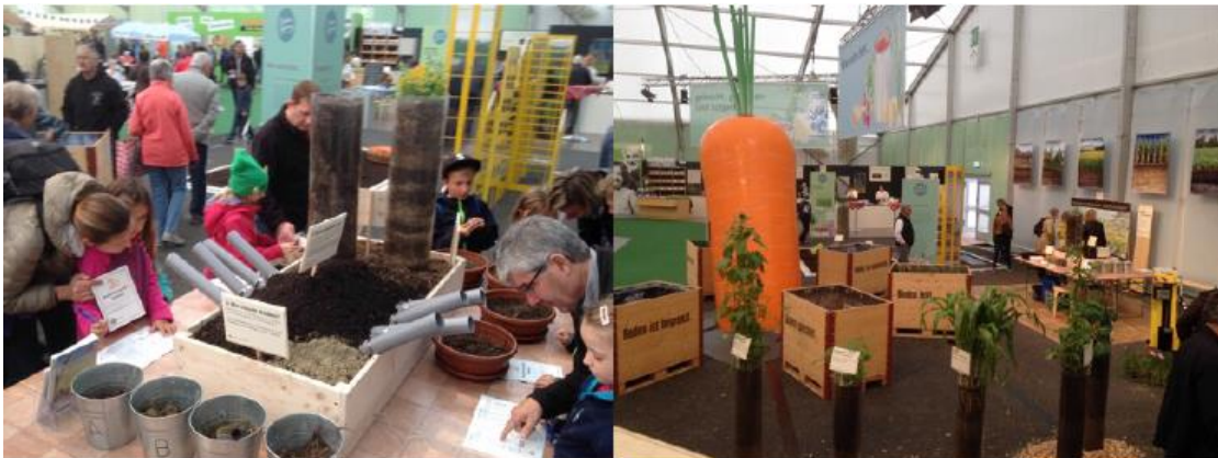
Impressionen von der Bodenausstellung an der OLMA